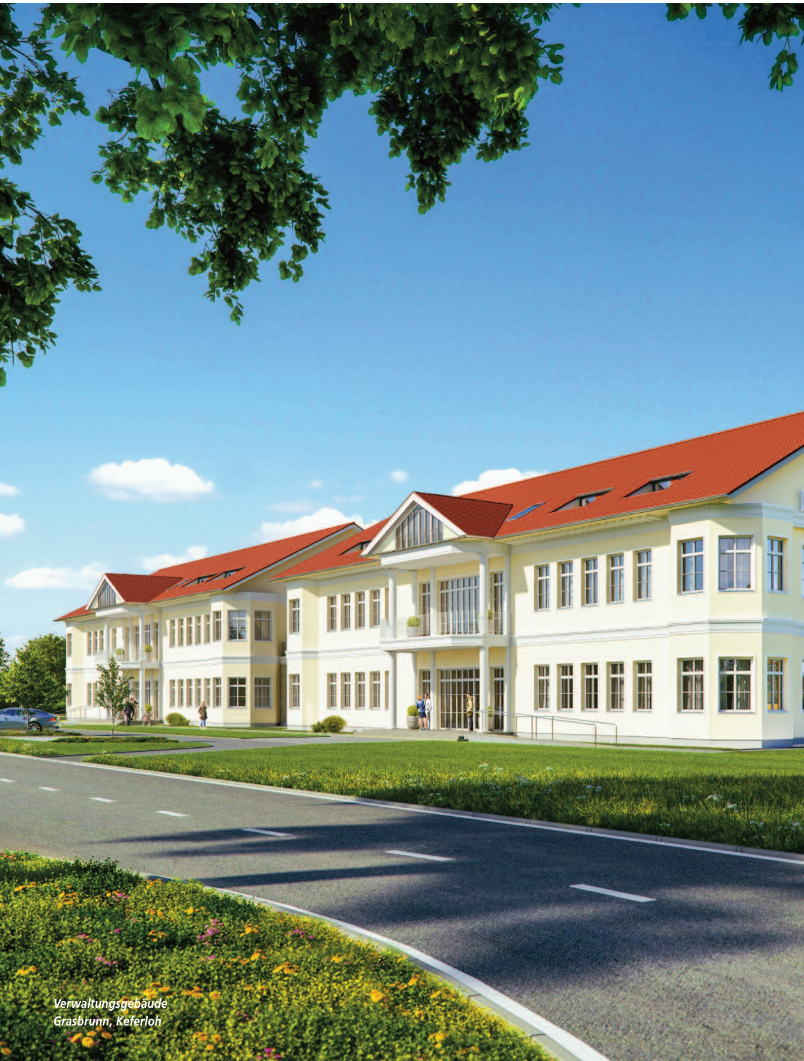
Verwaltungsgebäude Grasbrunn, Keferloh