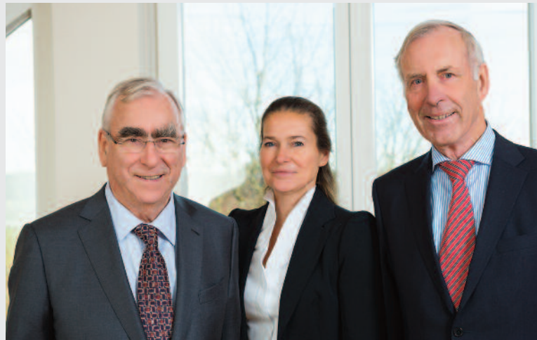
Dr. Theodor Waigel

Der Aufsichtsrat hat den Jahresabschluss, den Konzernabschluss, den Lagebericht und den Konzernlagebericht geprüft und erhebt nach dem abschließenden Ergebnis seiner Beratungen und Prüfung keine Einwendungen. Er hat den vom Vorstand aufgestellten Jahresabschluss und Lagebericht gebilligt und den Konzernabschluss nebst Konzernlagebericht zum 31. Dezember 2018 billigend zur Kenntnis genommen; der Jahresabschluss ist damit festgestellt.