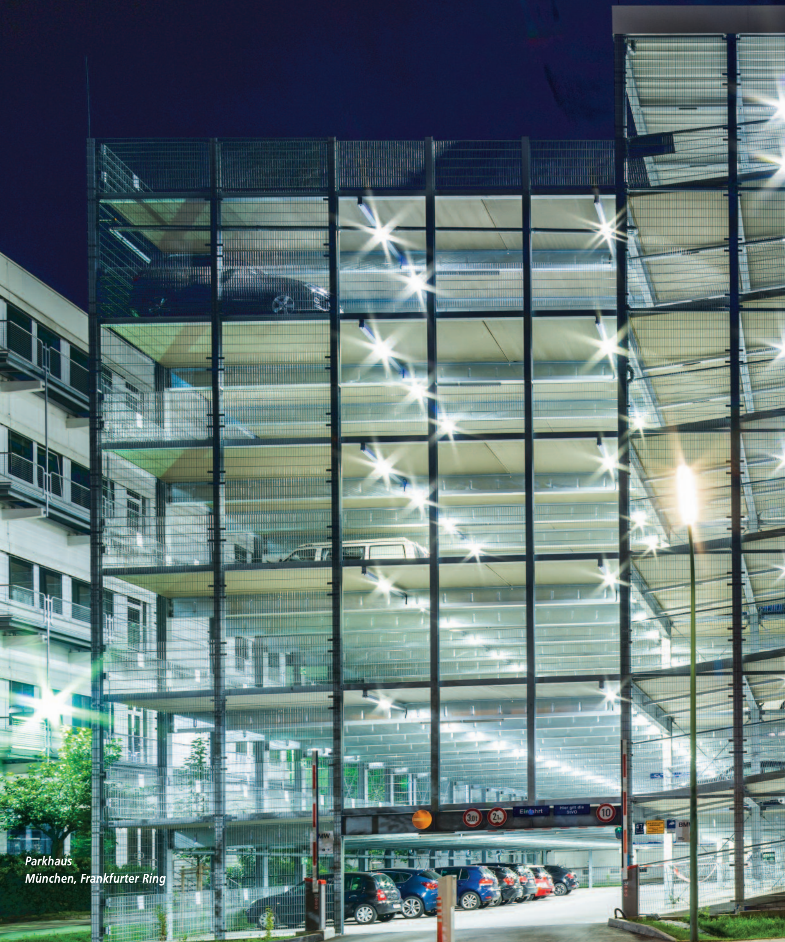
Parkhaus München, Frankfurter Ring