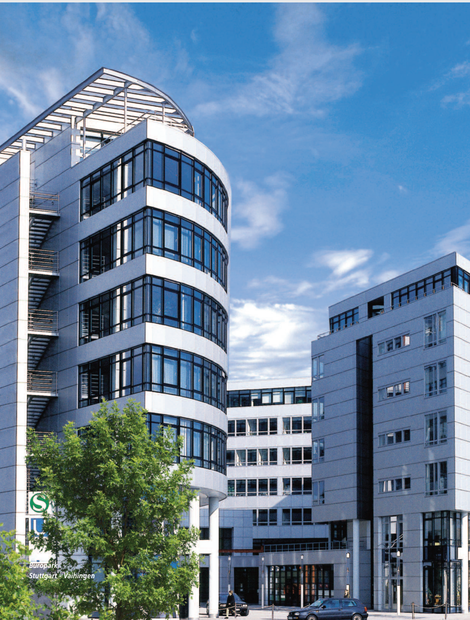
Buropark Stuttgart - Vaihingen