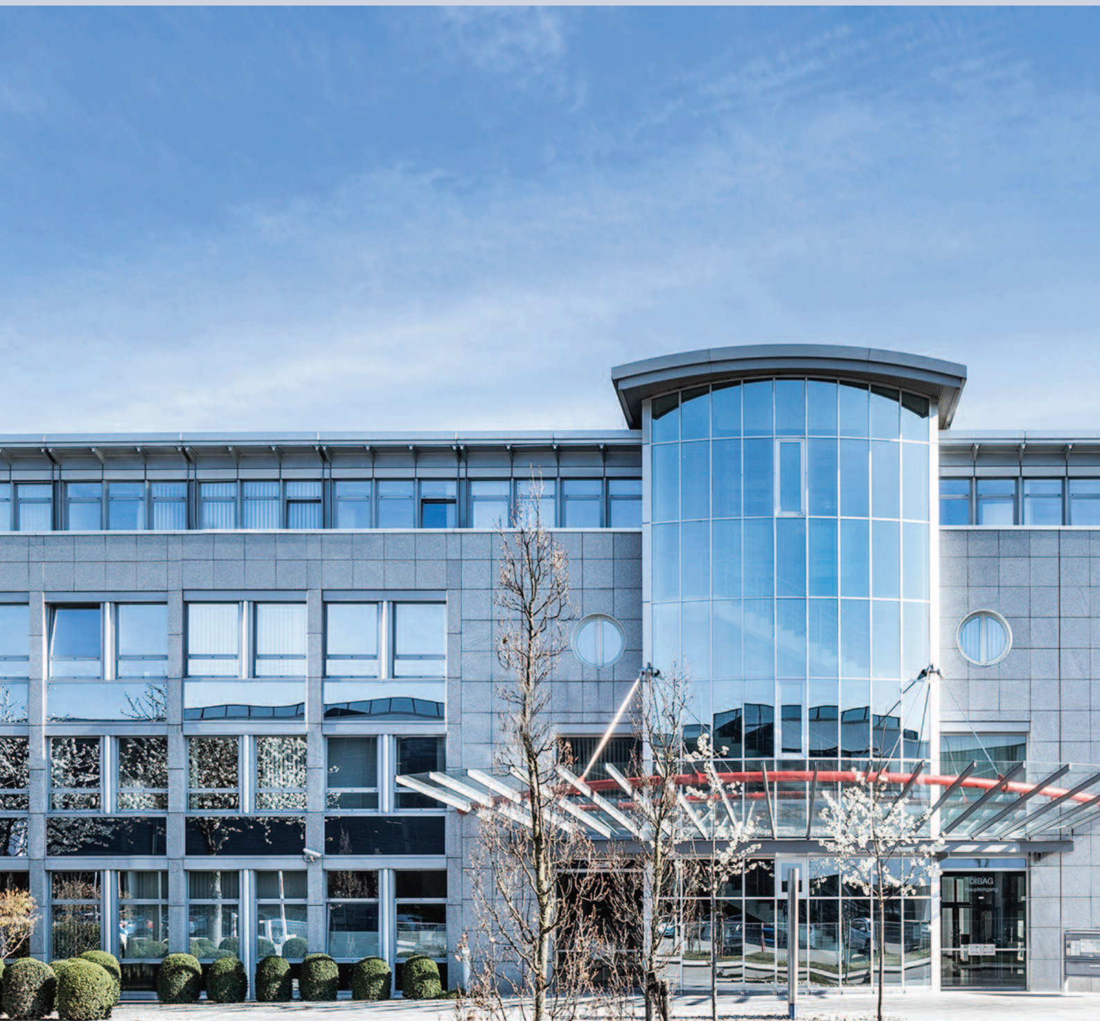
Büro- und Gewerbepark Lilienthalallee München