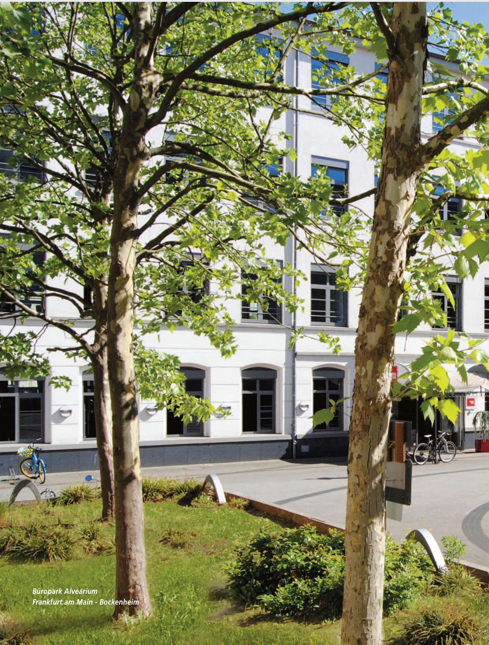
Büropark Alvearium Frankfurt am Main - Bockenheim